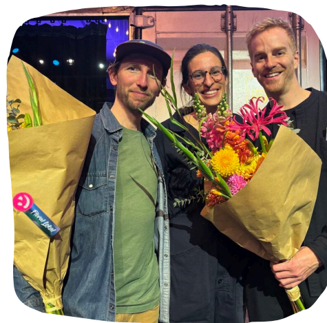
Photo: Lauréats de ClimaNow

Parallèlement, les projets d'impact de VaLoo renforcent le dialogue avec les autorités cantonales, et les acteur.rice.s des secteurs de l'architecture et de l'agriculture manifestent également un intérêt croissant pour l'assainissement circulaire.