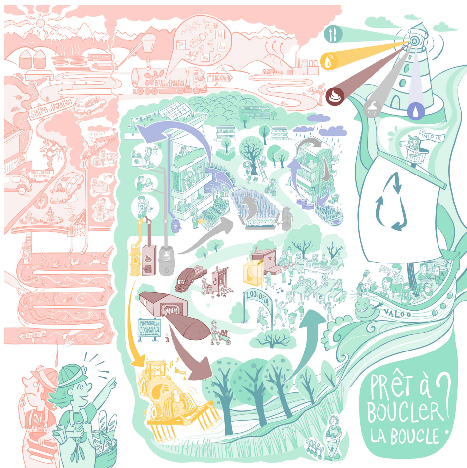
Fig. 1 Illustration: Lukas Baumgartner

VaLoo, le Réseau pour l'Assainissement Circulaire en Suisse, a été fondé le 19 novembre 2021 à l'occasion de la Journée Mondiale des Toilettes. VaLoo rassemble des acteurs et actrices engagé.e.s qui collaborent pour promouvoir et faciliter la mise en œuvre de systèmes d'assainissement circulaire suisse.