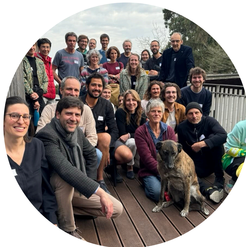
Photo: Assemblée des Members 2025