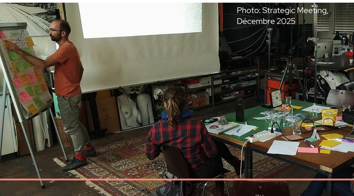
Photo: Strategic Meeting, Décembre 2025