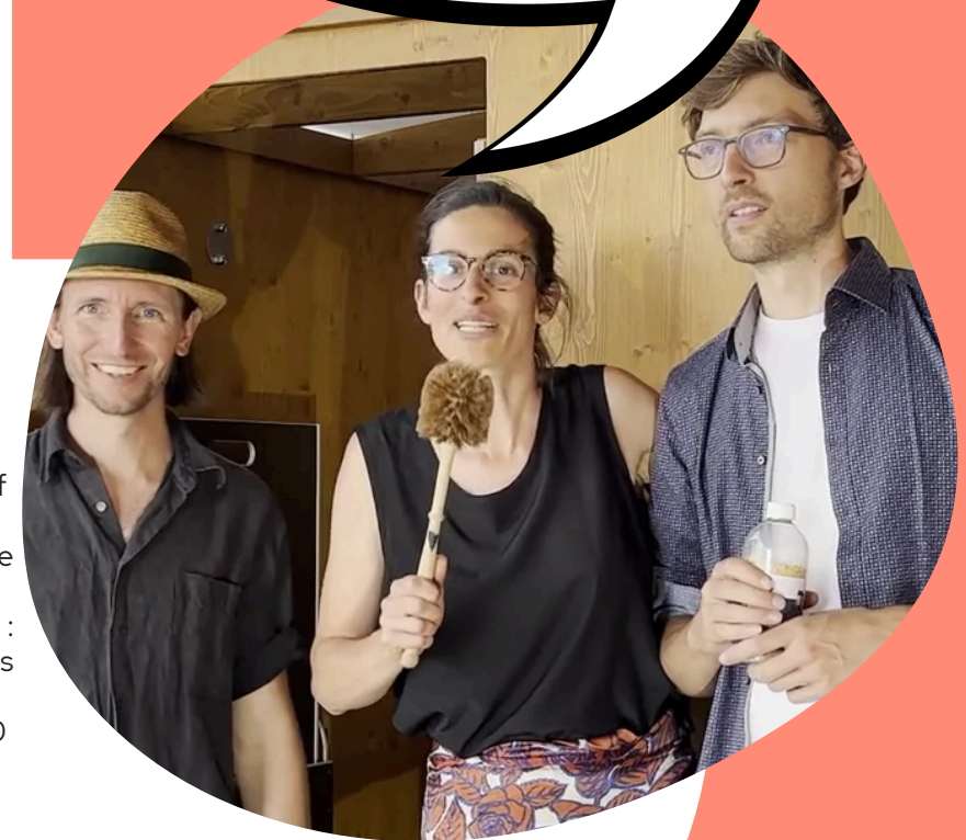
Photo: Circular Toilet, ClimaNow 2025

Toutes les manifestations sont publiées et mises à jour régulièrement sur notre site internet, rubrique " à la une ".