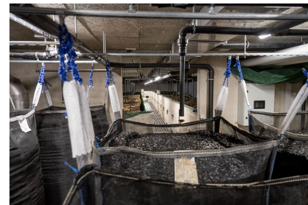
Photo: Installation locale et circulaire de traitement des eaux usées, la Bistoquette

Le projet « Greywater Reuse » de la ZHAW s'est penché sur ce potentiel et a démontré que le recyclage décentralisé des eaux grises est techniquement faisable, mais encore insuffisamment intégré dans le cadre réglementaire suisse. Pour favoriser son adoption à plus grande échelle, des clarifications juridiques s'imposent, ainsi qu'une meilleure collaboration entre autorités fédérales, cantons et acteurs industriels. Les recommandations issues du projet constituent une base utile pour alimenter ces discussions et orienter les futures évolutions réglementaires.