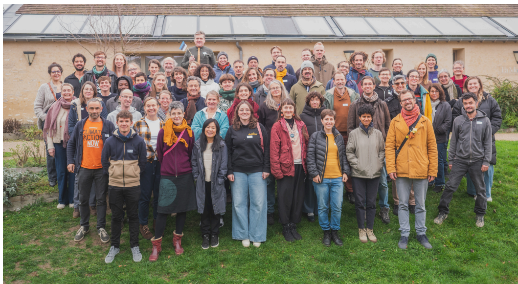
Photo: Congrès Européen de l'Assainissement Circulaire, co-organisé par VaLoo